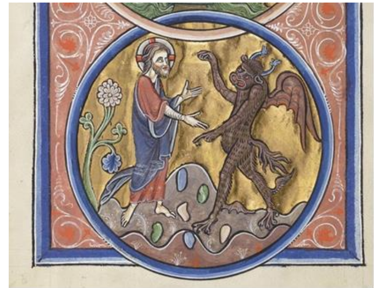
Jésus au désert - Psautier de St Louis - vers 1230

Entre le baptême de Jésus (où une voix venant du ciel dit : « Tu es mon fils bien-aimé ») et ce passage des tentations du Christ, (« Si tu es le fils de Dieu », dit le Diable), Luc place la généalogie de Jésus, avec pour principaux ascendants : David, Abraham et « Adam, fils de Dieu ». Il nous présente ainsi Jésus, vrai Dieu et vrai homme !