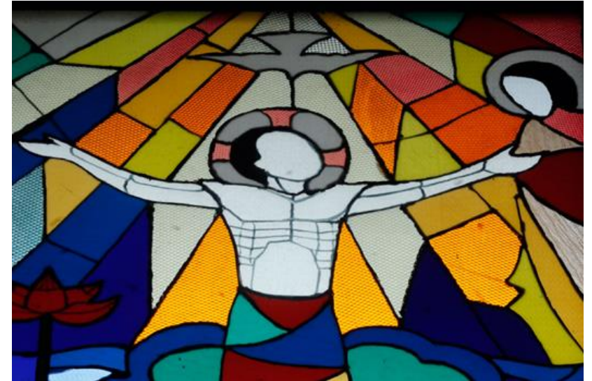
L'Ascension de Jésus , vitrail de l'abbaye de My Ca au Vietnam

D'après Les Évangiles – Textes et commentaires – Bayard 2001